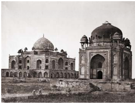
Humayun's Tomb, India

هستی اثر هنری به مثابه یک شیء ۱ (ابژه) در گرو ماهیت او، و ماهیتش در گرو آنچه آرته ۲ آن شیء رقم میزند، دستخوش تلاطم این سویی و آن سویی است؛ این هستی یافته، در ارجمندی ماهیت آغازین ۳ اثر مجال حصول یافت، حال آنکه به سبب ناپایا بودن آرته خویش، ماهیت این هستی نیز ماهیتی پایا نیست، و این مرتبه، مرتبه فتح باب ماهیت آغازین ۴ اثر هنری است. و این باب در ید قدرت گروئون ۵ ، با سه سر؛ سر اول را خالق اثر هنری راهبر است، سر دوم را مخاطب، و سر سوم را خود اثر عنان دارد.