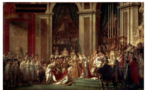
Jacques-Louis David, Consecration of the Emperor Napoleon and the Coronation of Empress Joséphine on December 2, 1804 Musée du Louvre. Paris. France

موضوع اسکیس: در دانشکده فلسفه دانشگاه فرایبورگ ۶ آلمان، تصمیم بر طراحی فضایی است تا بیانگر و نماد تفکر باشد، در این راستا یکی از سراسرهای دانشکده جهت ایفای این نقش در نظر گرفته شده. الزام گردیده تا از یک نمونه کپیبه دقیق مجسمه متفکر ساخته آگوست رودن ۷ ، جهت قرارگیری در فضا بهره برند. مطلوب است طراحی فضای مذکور؛ بدیهی است تعریف اجزاء فضا و کاربری ها مطابق آنچه طراح با آزادی کامل لازم می داند صورت می پذیرد. ارائه طرح اسکیس به سایز ۳۵×۵۰ cm (ارائه بایست رسا و گویای جنبه های مختلف طرح، بدون هر گونه ابهام باشد).