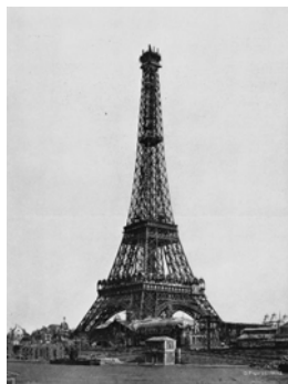
Eiffel Tower, Paris, France